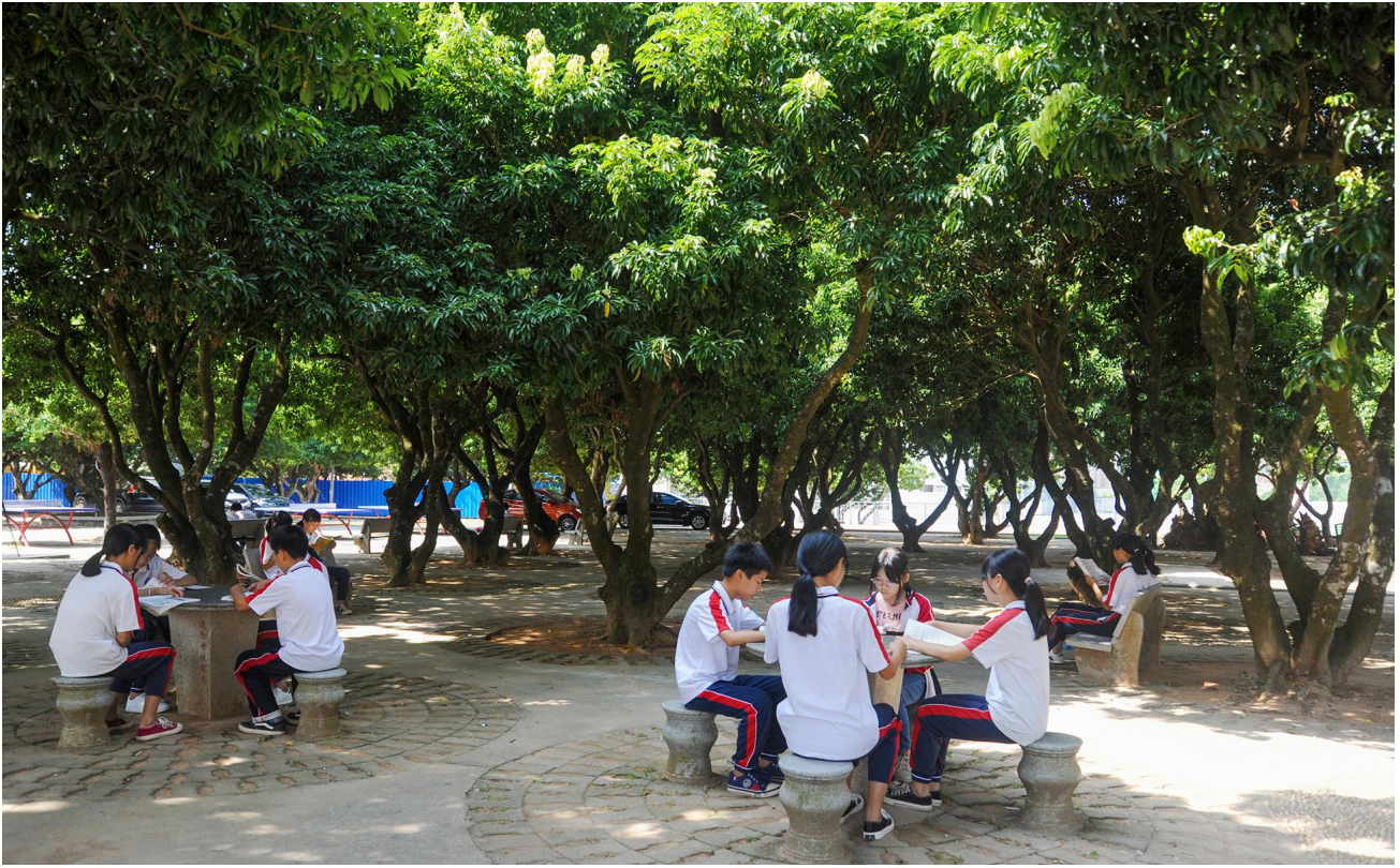
优美舒适的校园环境